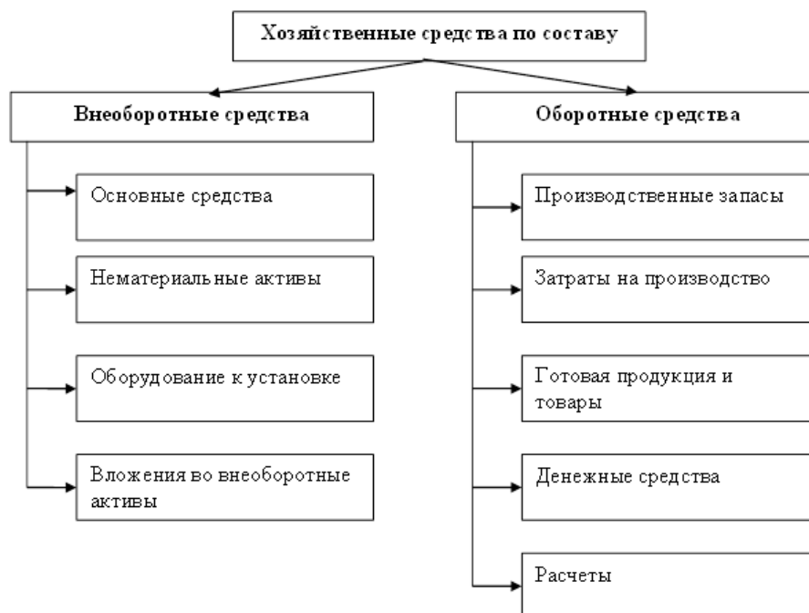
Рисунок 1 – Группировка хозяйственных средств по составу и размещению

Группировка средств по источникам формирования и целевому назначению означает, из каких источников получены средства предприятия, и на какие цели. К источникам относятся собственные и заемные средства, схема группировки представлена на рисунке 2.