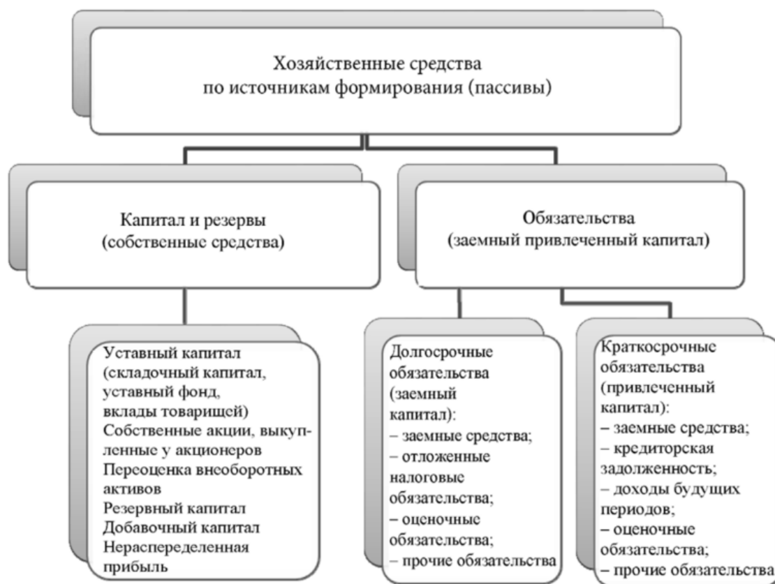
Рисунок 2 – Группировка хозяйственных средств по источникам формирования

Группировка средств по источникам формирования и целевому назначению означает, из каких источников получены средства предприятия, и на какие цели. К источникам относятся собственные и заемные средства, схема группировки представлена на рисунке 2.