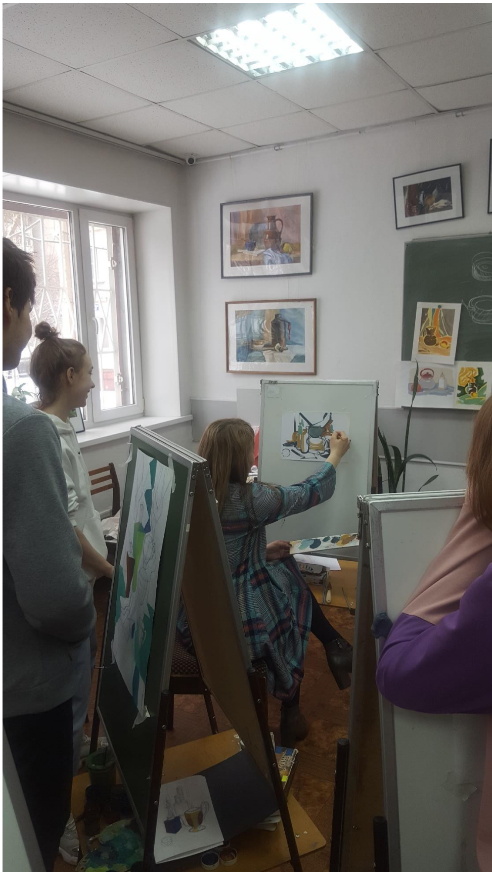
Преподаватель демонстрирует приемы работы.