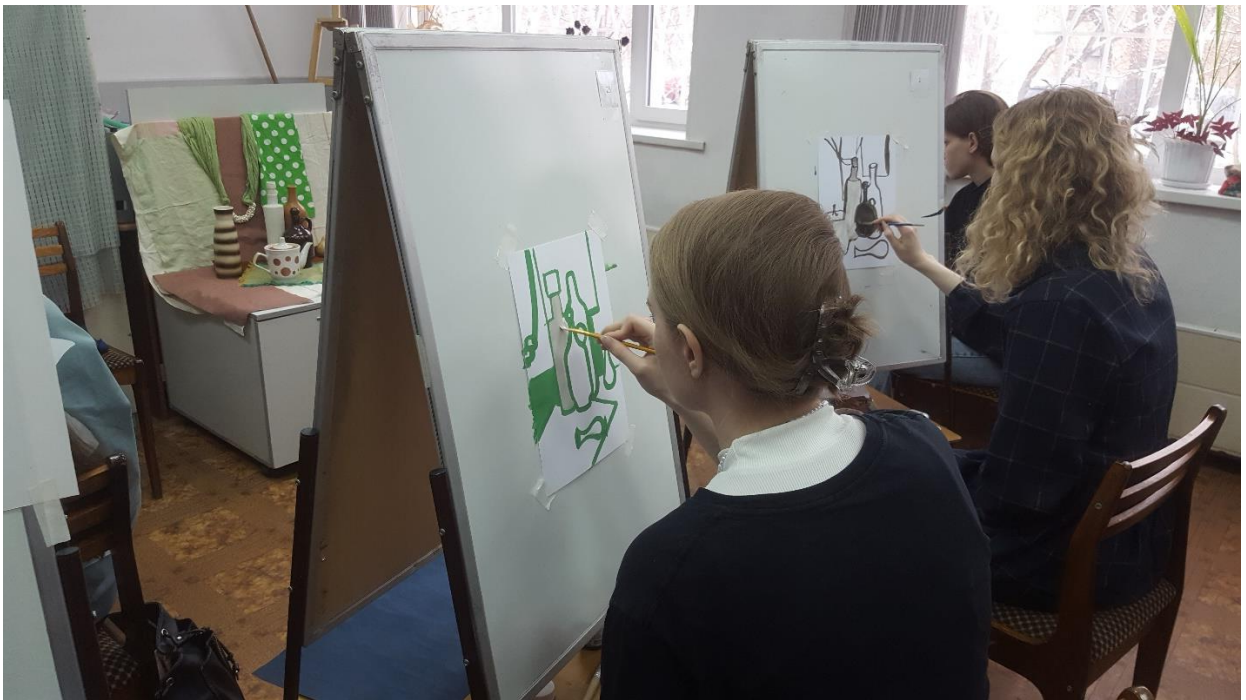
Студенты выполняют задание.